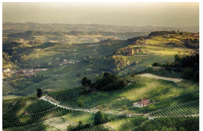
Le Langhe del Barolo - Patrimonio Unesco