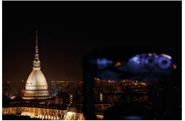
Mole antonelliana - Torino