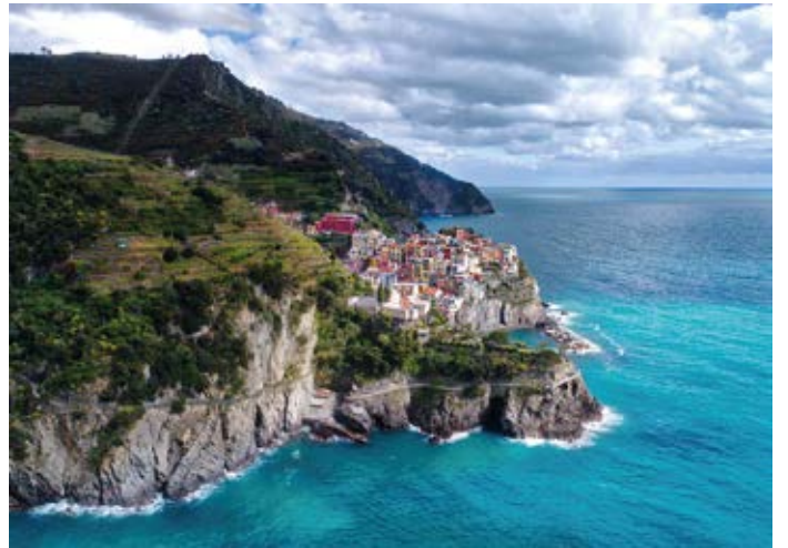
Parco Nazionale delle Cinque Terre - La Spezia