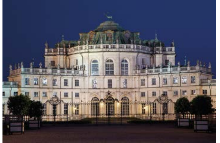
Palazzina di caccia - Stupinigi