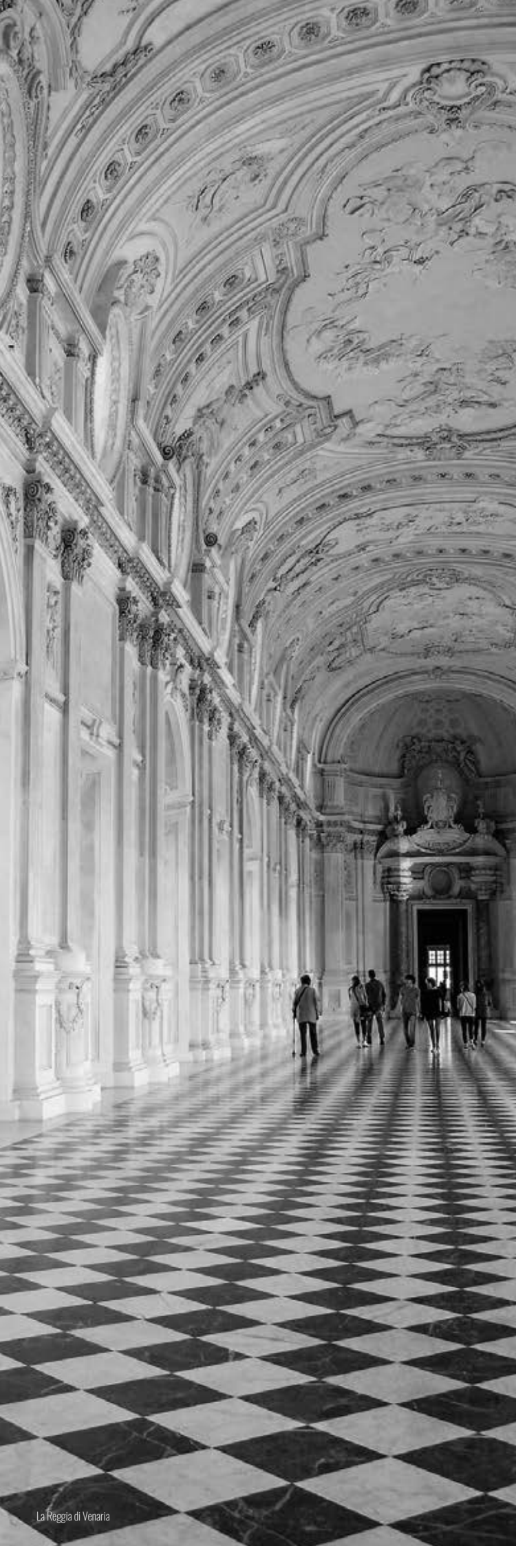
La Reggia di Venaria