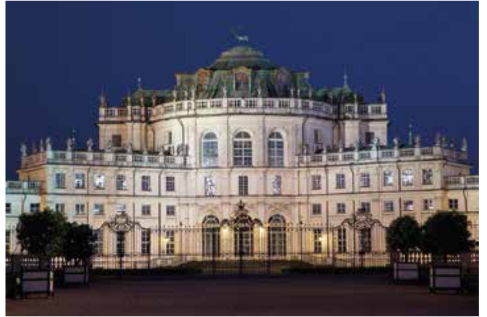
Palazzina di caccia - Stupinigi