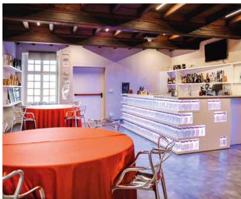
SALA BAR DIDATTICA