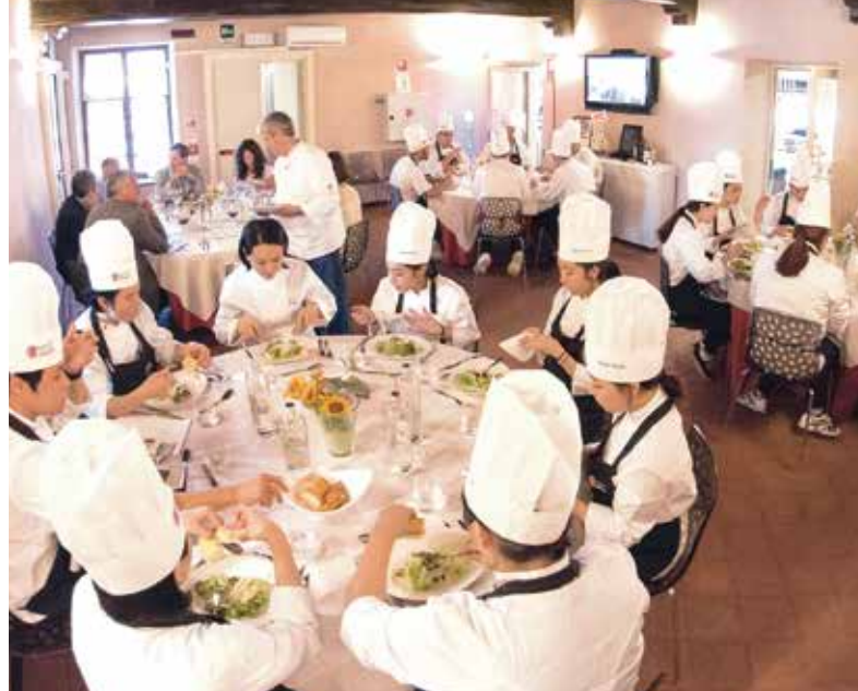
SALA RISTORANTE INTERATTIVA