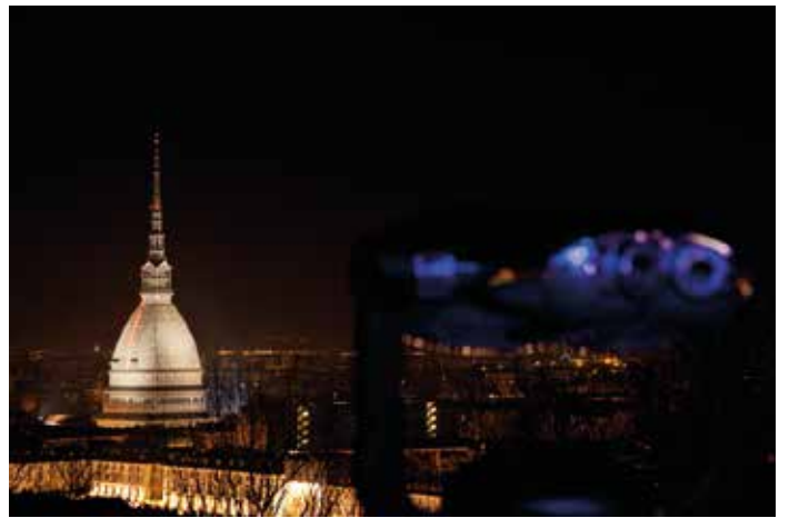
Mole Antonelliana - Torino