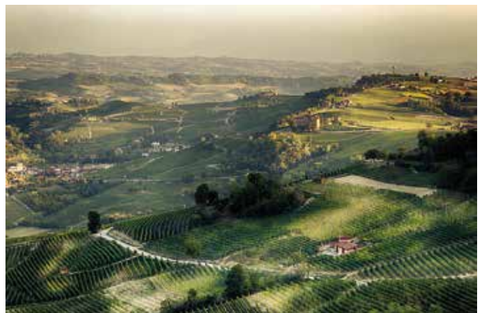
Le Langhe del Barolo - Patrimonio Unesco