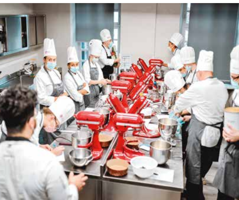
LABORATORIO D'ARTE BIANCA