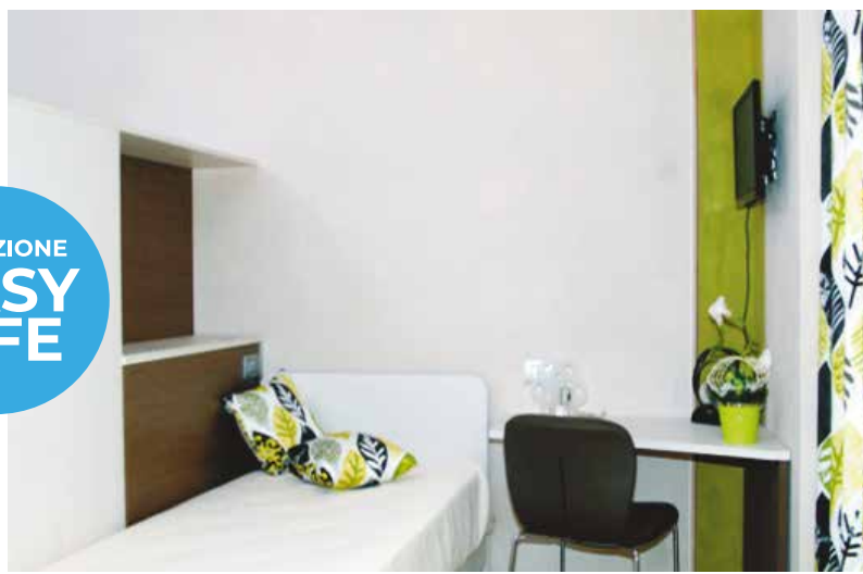
PIOBESI Torinese Camere tipo