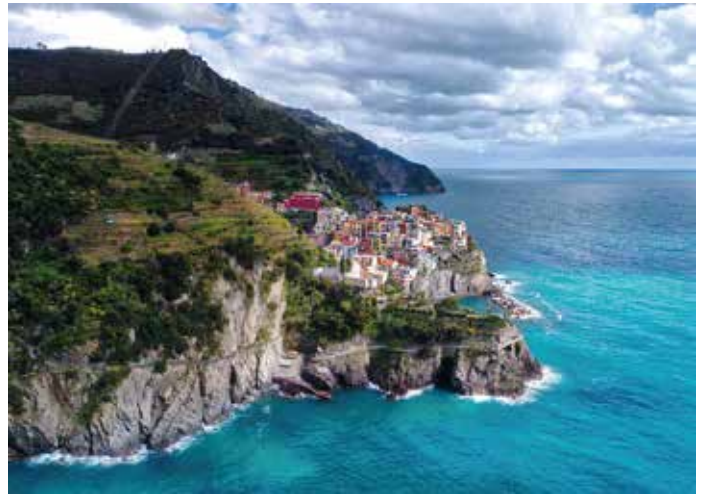
Parco Nazionale delle Cinque Terre - La Spezia