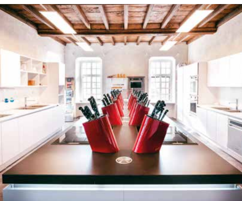
AULA PRATICA MEDIA STUDIO